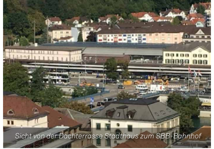
Sicht von der Dachterrasse Stadthaus zum SBB-Bahnhof