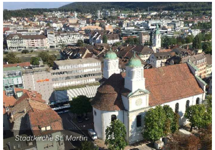
Stadtkirche St. Martin