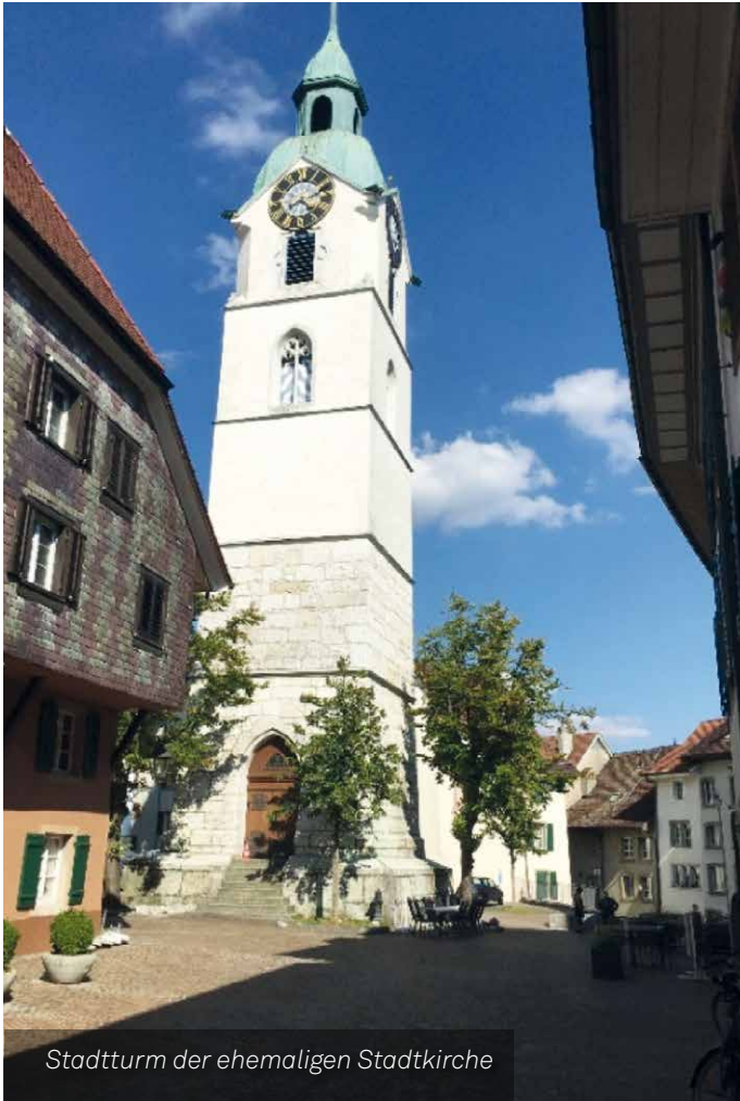
Stadtturm der ehemaligen Stadtkirche